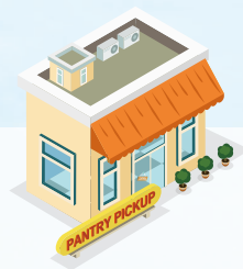
設置数と目標数 Number of pantries and targets (2020年2月時点)

10万人プロジェクトでは生活を支えるのに十分な食べ物を渡す体制を築きます。しかし、その要となるフードパントリーは海外の都市と比べてもまだまだ少ないのが現状です。東京でのゴールは2020年、73ヶ所のフードパントリー設置です。The aim of this project is to create a safety-net to provide people with enough food to support their daily lives. At this time the number of food pantries is still very small compared to other metropolitan cities overseas. Our goal is to have 73 locations in Tokyo by the end of 2020.