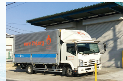
2HJ埼玉拠点では10トン車まで荷受け可能。 Food Pantry in Saitama.

We operate a food pantries as well as provide food to agencies and organizations.