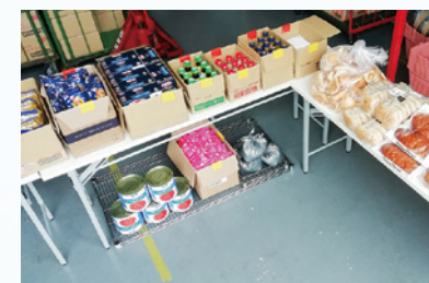
2HJ神奈川拠点内直営フードパントリー、他団体にも食品提供をしています。

Food pantries have been launched in these areas to meet local needs. Due to strong support from Saitama Prefectural officials there was much faster development of new food pantries. Strong leadership like this can make a huge difference in getting food to those in need.